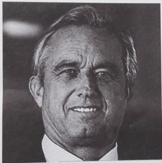
Robert F. Kennedy Jr.: Wir unterstützen die Malser in ihrem Kampf für ein Pestizid freies Dorf.